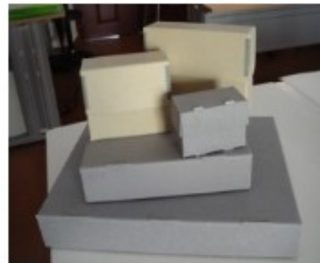
Acondicionamento em materiais específicos de conservação