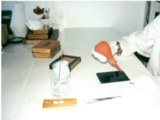
Limpeza e estabilização de espécies fotográficas