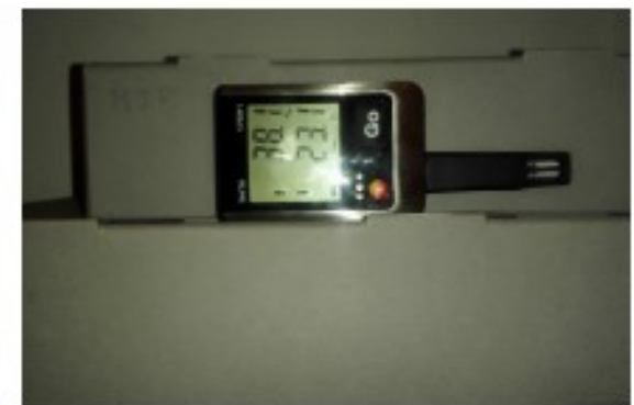
Controlo das condições atmosféricas dos depósitos